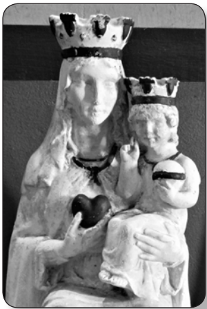
Hl. Franz v. Sales

„Alles gehört der Liebe, alles liegt in der Liebe, alles ist für die Liebe, alles ist aus Liebe in der heiligen Kirche“